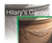
MACETEROS Y JARDINERAS DECORATIVAS RESINA